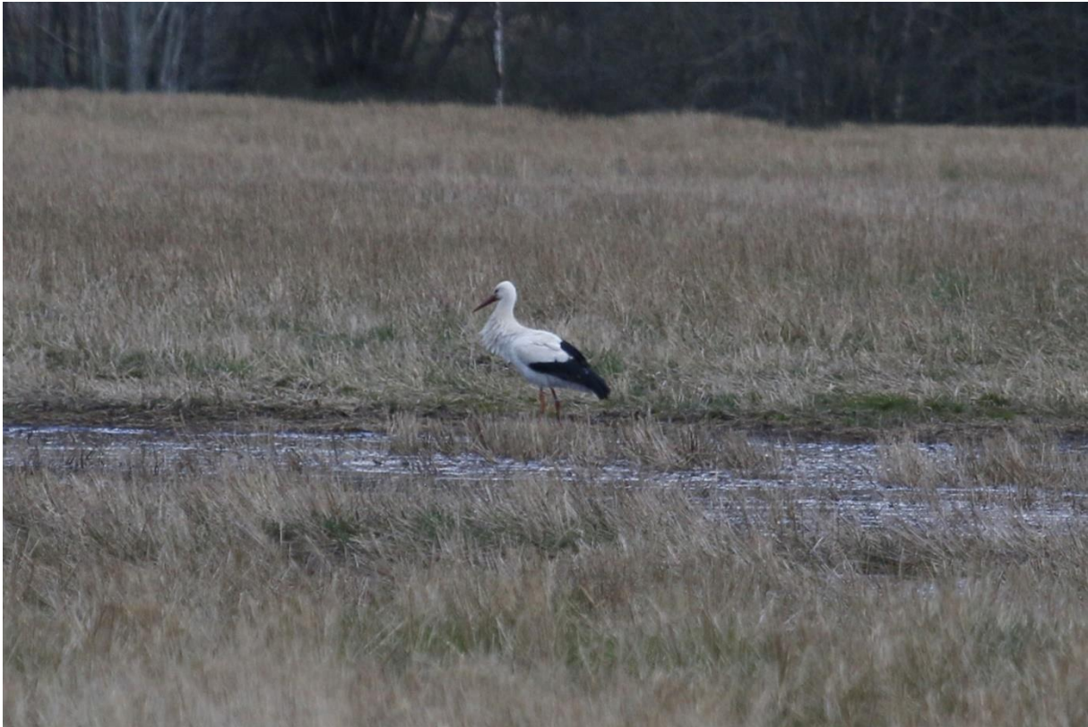
Vit stork, Landsbro.

1 ex. rastande Landsbro 2024-04-24 (Klas Kärvegård, Benny Hultqvist, Inge Schentz m.fl.)