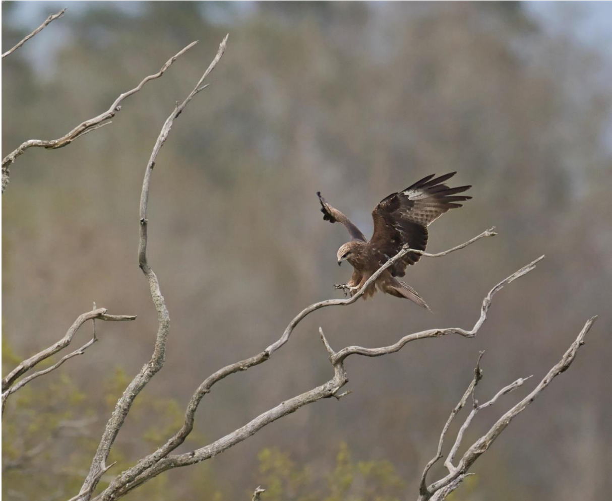
Brun glada, Skirösjön.