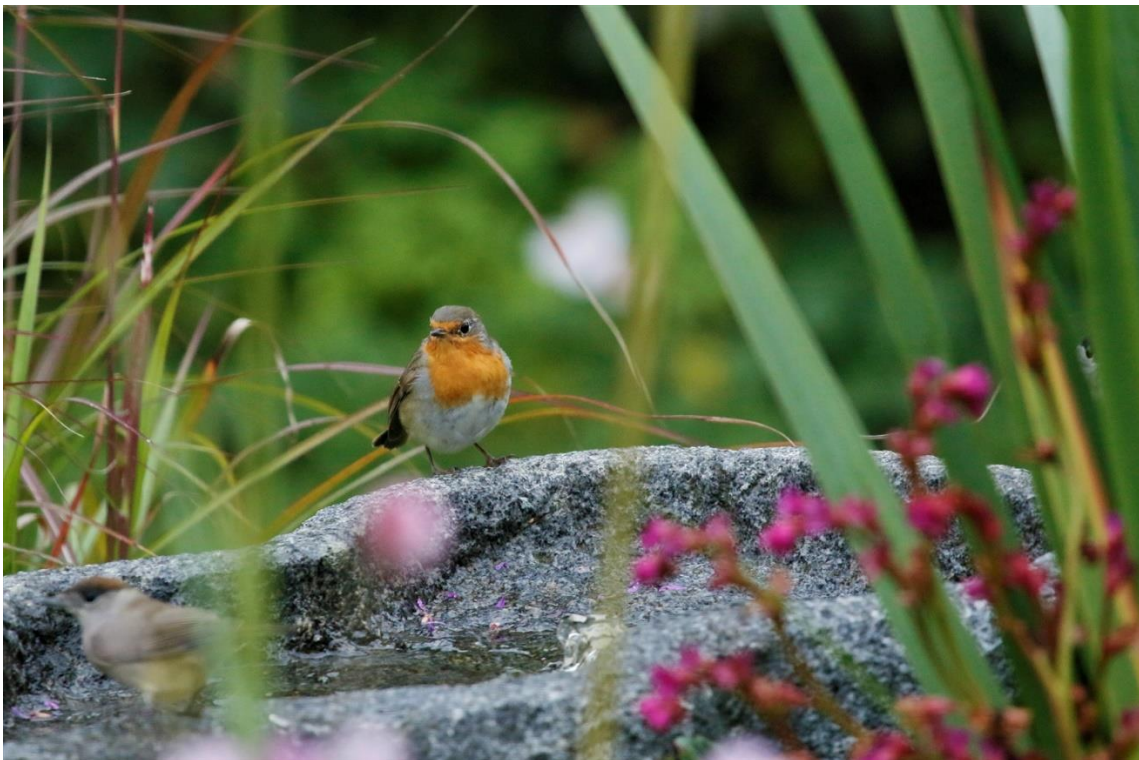
Rödake, Bäckseda.

Sävsjörutan inventerades 4/6 även den av (TCm). Här hittades i år 42 olika arter och totalt 231 individer. Att jämföra med 2023 då det påträffades 41 arter och totalt 285 individer. Siffran 42 olika arter för 2023 är under medeltalet som jag noterat sedan 2013 då jag började inventera Sävsjörutan. Däremot är totala antalet individer 231, långt under medeltalet.