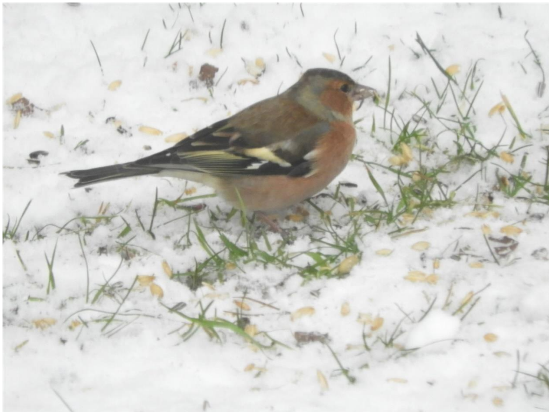
Bofink, Vetlanda.

Under 12 års sommarpunktrutter i "Ramkvilla-rutten" har totalt 91 olika fågelarter noterats.