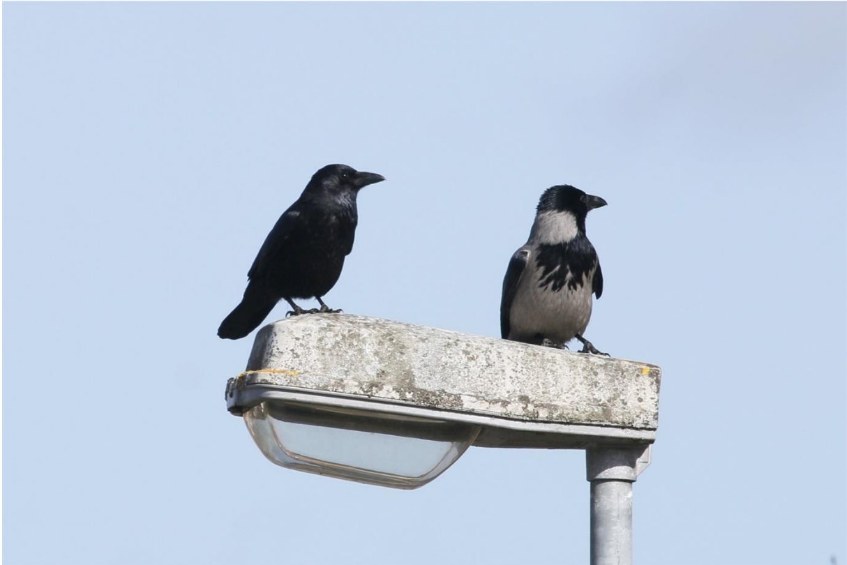
Svartkråka, Vetlanda.

1 ex. rastande Vetlanda 2024-04-13 – 2024-12-03 (Michael Engström, Tomas Claesson m.fl.)