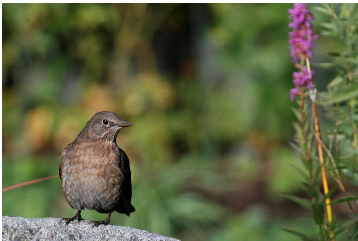
Koltrast, Bäckseda.