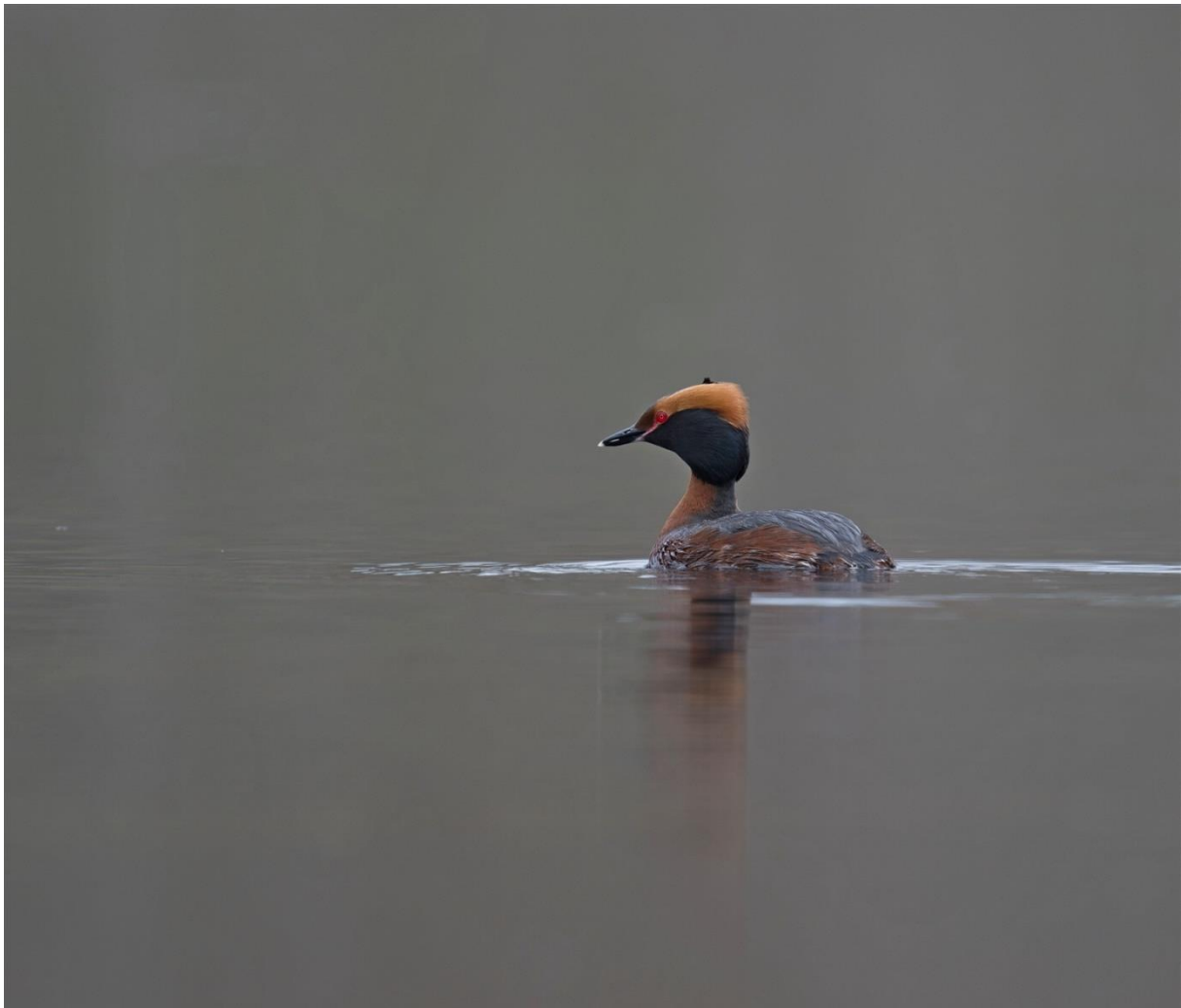
Svarthakedopping, Trishult.