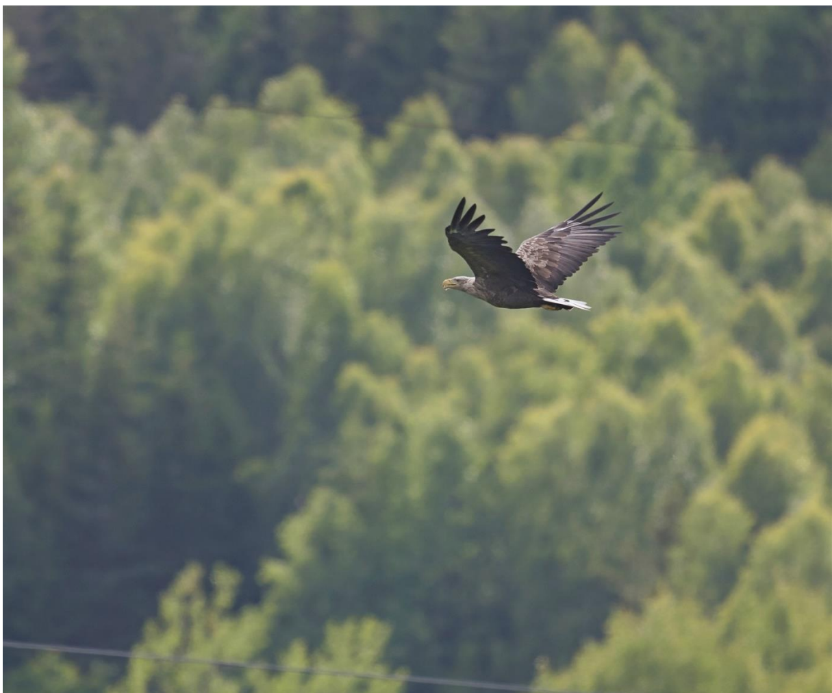
Havsörn, Nävelsjön.