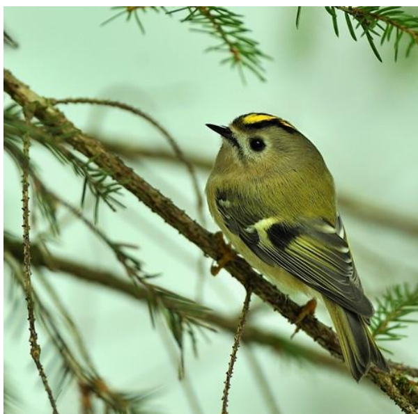
Vanlig kungsfågel, Emån.