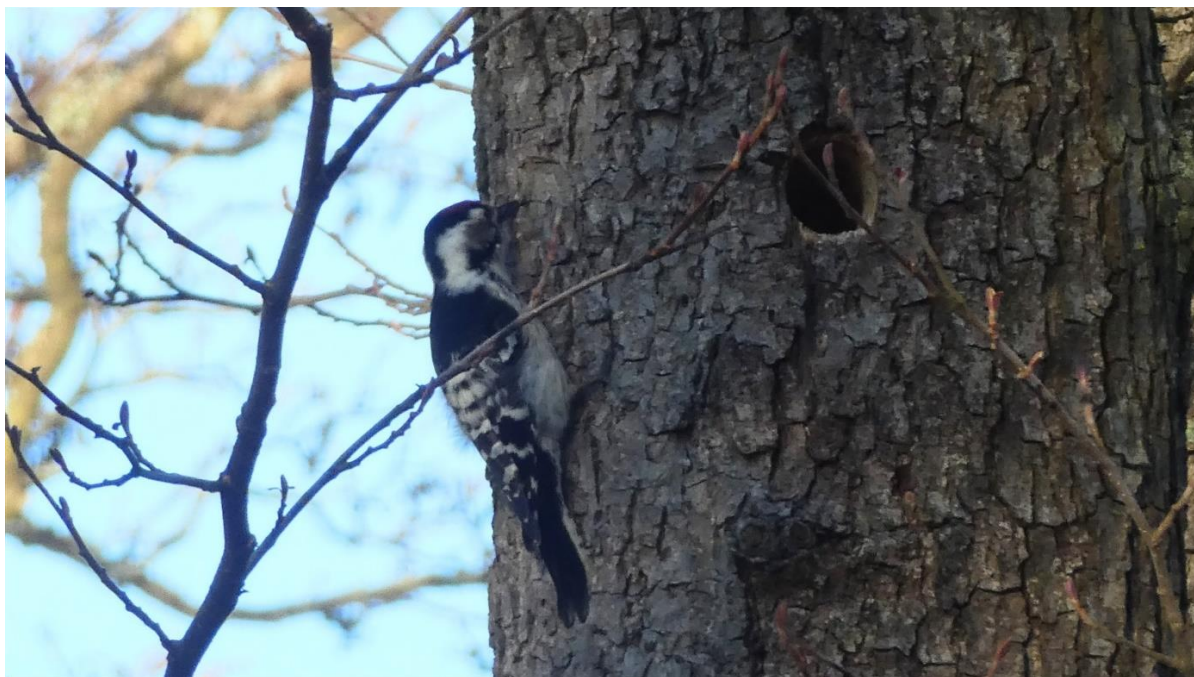
Mindre hackspett, Vetlanda.