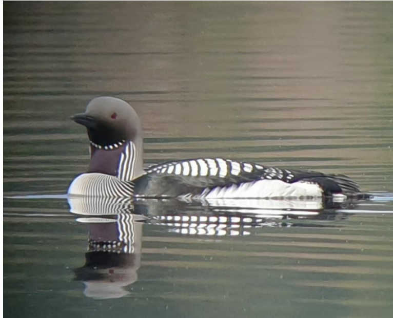
Storlom, Grumlan.